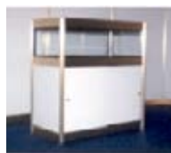
Ref. 113C taulell amb vitrina, prestatge i portes 100x100x50 cm 28,00€