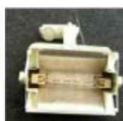
Ref. 160C focus troll extra 2,00 €