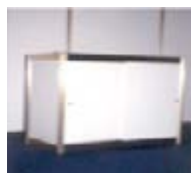
Ref. 113 taulell 100x100x50 cm 19,70 €