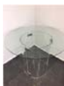
Ref. 104B taula rodona vidre 90 cm 19,90 €