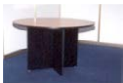
Ref. 104C taula rodona 120 cm 9,90 €