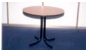
Ref. 104 taula rodona 90x74 cm 8,90 €