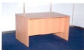
Ref. 103 taula despatx 120x80x74 cm 13,75 €