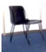
Ref. 102 cadira anatòmica negra 4,00 €