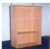
Ref. 112C prestatgeria fusta 200x100x25 cm 12,00 €