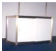
Ref. 113B taulell amb prestatge i portes 100x100x50 cm 22,00 €