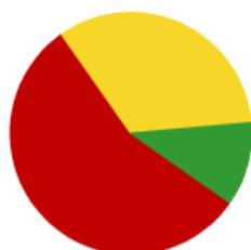
Viviendas Turísticas Vacacionales