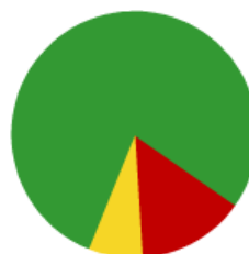
Alquiler de Vehículos