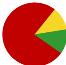
Total de todos los sectores

¿Cómo ha evolucionado su facturación del mes de julio con respecto al mismo mes del año pasado?