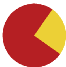
Viviendas Turísticas Vacacionales