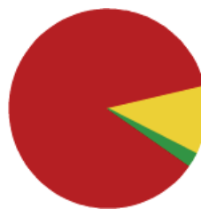
Cafeterías, bares y restaurantes