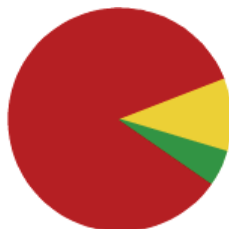
Total de todos los sectores

¿Cómo ha evolucionado su facturación del mes de mayo con respecto al mismo mes del año pasado?